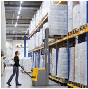
Exaktes und einfaches Stapeln der Ladung