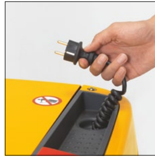
Der Einbaulader auch für größere Batterien