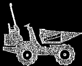
C805s | C807s | C810s

Alle Abbildungen, Maße und Gewichte entsprechen nicht immer der Serienausstattung und sind gegenüber Toleranzabweichungen auf Komponentenebene unverbindlich. Technische Änderungen vorbehalten.