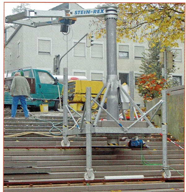
► Der „Bergsteiger“ unter den Steinversetzkränen.