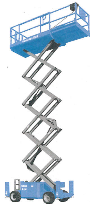
Abb. nur zu Illustrationszwecken. CE Maschinen sind mit Scherenschutz-Paket ausgestattet.